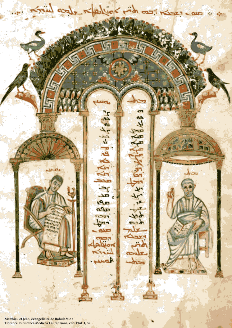
Matthieu et Jean, évangélistes de Rabula Vte s Florence, Biblioteca Medicea Laurenziana, cod. Plut. I, 56